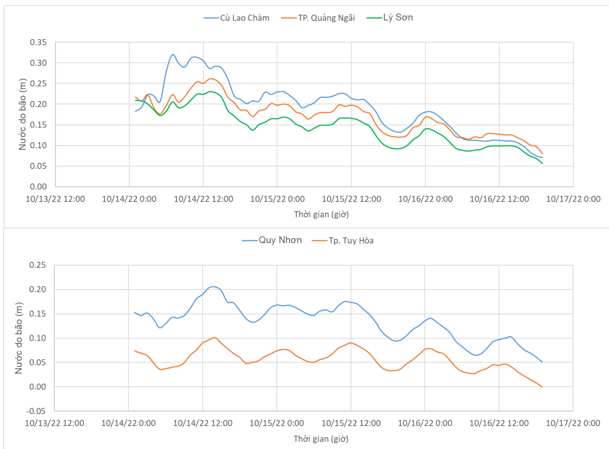
Biến trình nước dâng do ATNĐ tại một số trạm

Mức nước dâng do ATNĐ cao nhất khoảng 52 cm tại khu vực Phú Vang (Thừa Thiên Huế). Các khu vực ven biển kéo dài từ Thừa Thiên Huế đến Phú Yên mức nước dâng do ATNĐ dao động trong khoảng 10-52 cm.